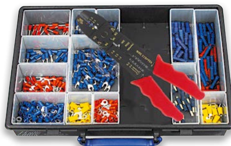
Art. Nr. 1938-011