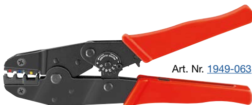
Art. Nr. 1949-063