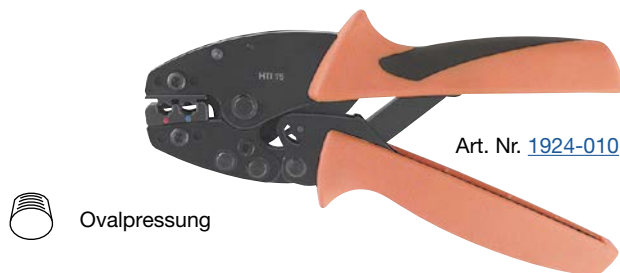
Art. Nr. 1924-010