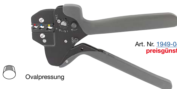
Art. Nr. 1949-047 preisgünstig