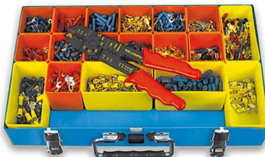
Art. Nr. 1938-037