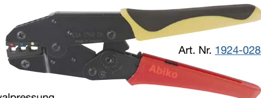
Art. Nr. 1924-028